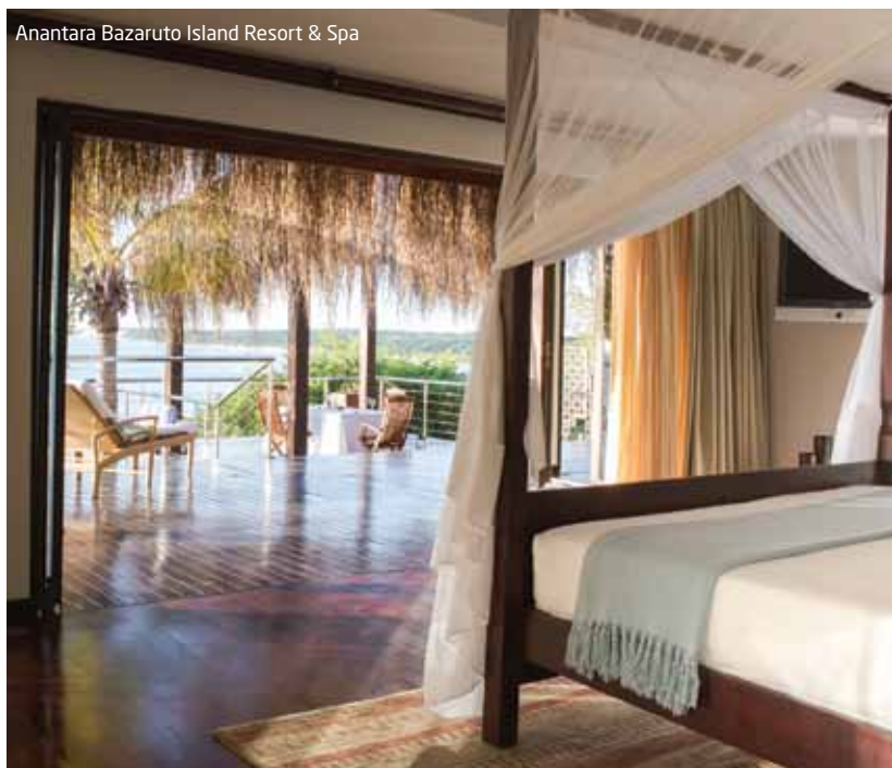
Anantara Bazaruto Island Resort & Spa