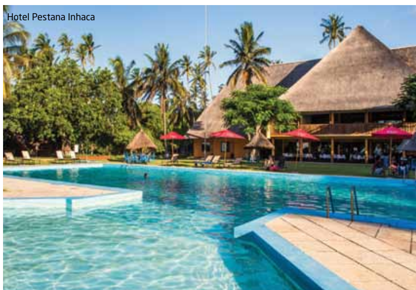
Hotel Pestana Inhaca